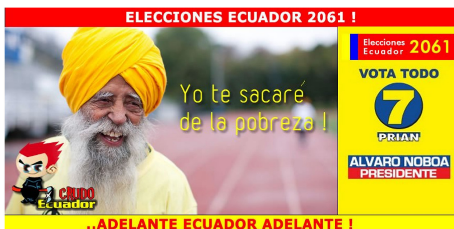
Meme 4. Post de Crudo Ecuador Publicado el 18 de febrero de 2013. Eterno perdedor

Las variables categóricas de Meta Actor, responden al señalamiento real metalingüístico de la UI, no siempre el actor principal es al que se refiere la UI. Las categorías servirán para determinar a qué meta actores políticos en forma real hace referencia Crudo Ecuador, además de hacer una segmentación entre UI afin al movimiento correísta y no correísta para un mejor estudio. Es necesario mostrar el número de actores políticos que Crudo Ecuador aborda obteniendo un total de 20 actores en 4 años (Tabla 4), se presenta a los principales.