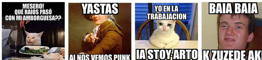
Figura 1. Identidad de los memes