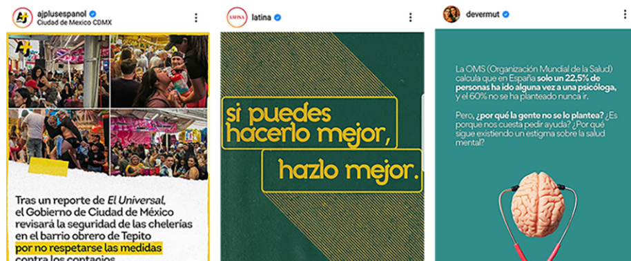
Figura 3. Resistencia de la lengua escrita en internet