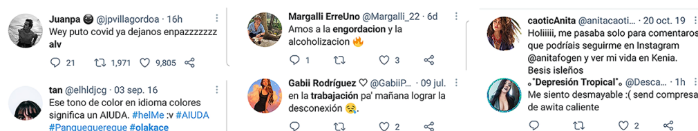
Figura 4. Flexibilidad de la lengua escrita en internet

Fuente: Universo narrativo de Twitter 2021