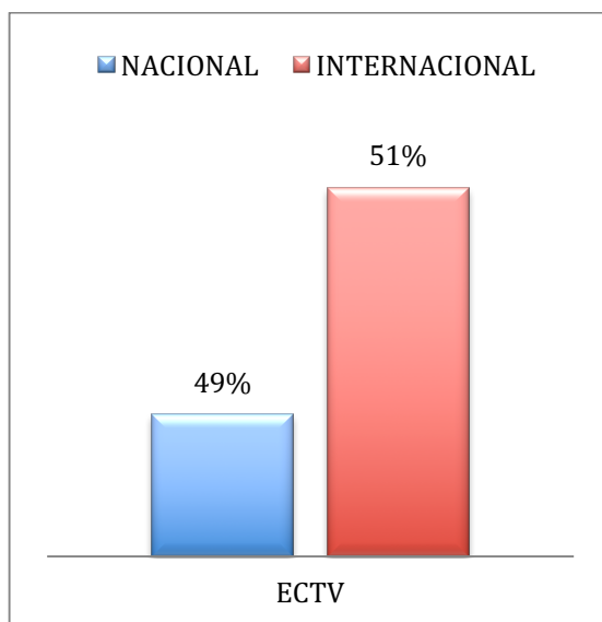
Gráfico 3. Origen de la programación en el canal público

Elaboración propia. Fuente: Canales nacionales de Ecuador- septiembre 2014